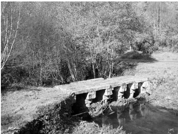
Imagen 1: Bande. Puente de piedra en la ruta. Fotografía del autor, 2019