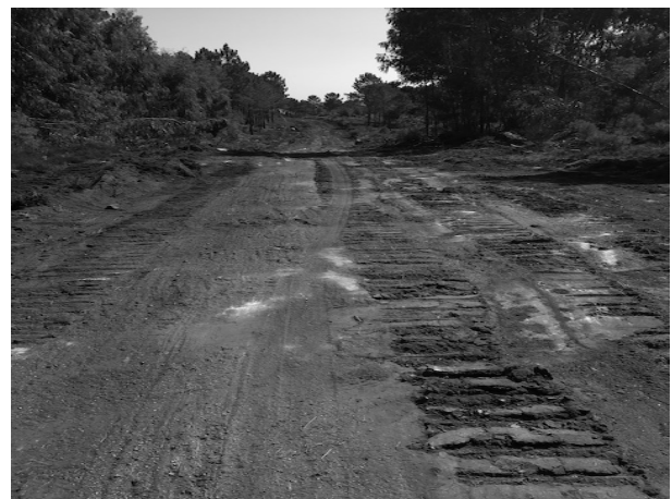
Imagen 4: Cenlle. Camino destruido por el paso de maquinaria pesada.