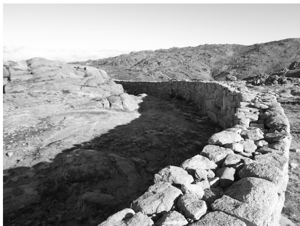
Imagen 5: Lobios. Vista parcial del Foxo do Lobo. Fotografía del autor, 2019.

Bajo iniciativa del Parque Natural de Baixa Limia-Serra de O Xurés: