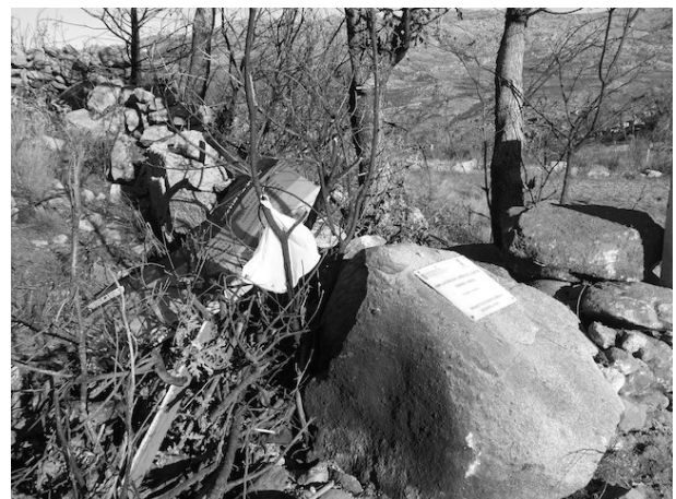
Imagen 6: Lobios. Paneles en el acceso al camino con información sobre la obra de acondicionamiento. Fotografía del autor 2019.

En este sentido también cabe indicar que el acceso a la información en línea de las rutas del parque es parcialmente posible a través de dos páginas web diferentes en el caso de las de senderismo [7] y BBT [11]. Aquí tampoco se incluye la información general